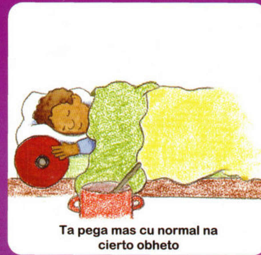
Ta pega mas cu normal na cierto obheto